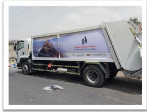
صورة(١)سيارات نقل المخلفات الجديدة. صورة(٢)عمال النظافة أثناء تأدية عملهم.

أبعاد مشكلة النفائيات الصلبة البلدية على الإنسان والبيئة في مدينة تعز: